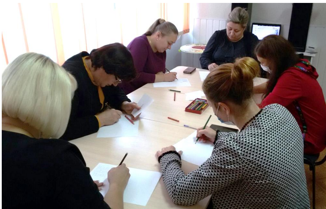
Профориентационное занятие с элементами тренинга «Шаг в профессию»